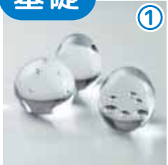
ペーパーウェイト